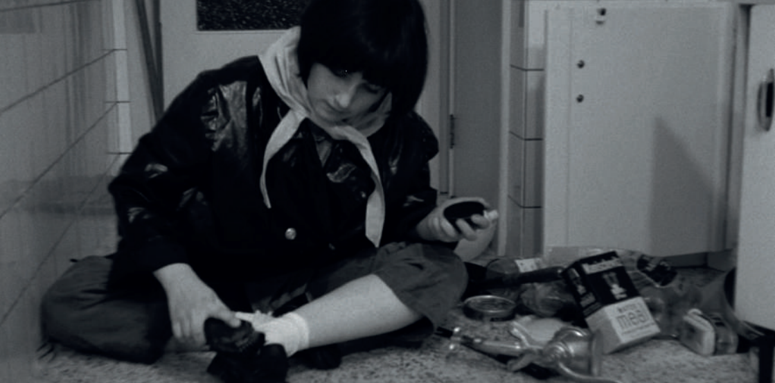
Chantal Akerman, Saute ma ville , 1968

What is feminism today? What engaged images does it produce? How can we make it converse with the feminism of the 1960s, '70s, and '80s, whose influence is evident in both formal experimentation and political commitments? Through a series of screening-dialogues, we aim to create conversations between women artists from both historical and contemporary feminist movements: What battles have been won, and which ones still urgently need to be fought? Feminist discourse, which now goes beyond the notion of gender, asserts itself today to deconstruct hierarchies, think about a principle of equality, and establish a "community founded on reality" as Erika Balsom reminds us.