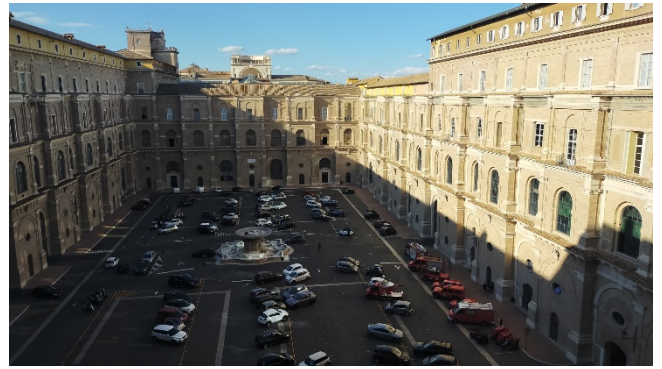
Figure 1 : Vue de la Cour du Belvédère, donnant accès à la bibliothèque (au fond).

Grâce à l'aide apportée par la Graduate School of East Asian Studies et l'UFR LCAO, j'ai pu mettre un premier pied dans la recherche doctorale en me rendant au Vatican, en plein cœur de Rome. Mes recherches de master portaient en effet sur l'histoire du catholicisme au Japon aux XIXe et XXe siècle, sujet que je prolonge dans ma thèse. Il était donc essentiel pour moi de pouvoir consulter les archives et la documentation disponibles dans les institutions du Saint-Siège, au cœur de mon sujet. Cette bourse de terrain a donc été un apport précieux dans mon parcours de jeune chercheur.