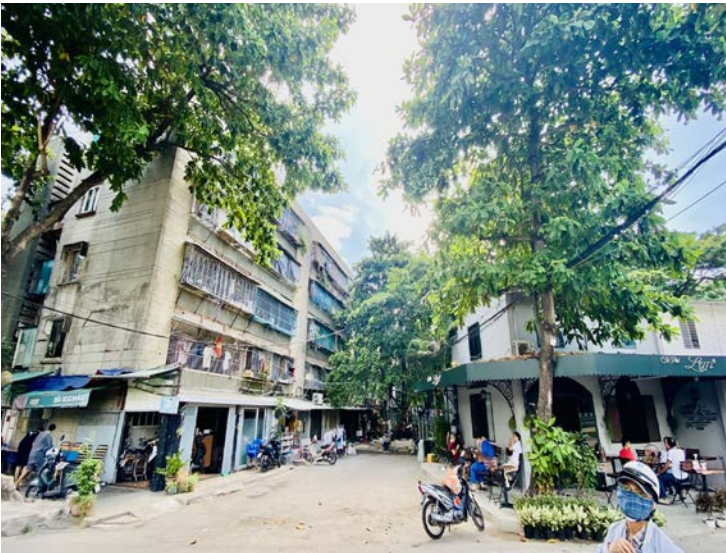
Figure 3: Une des allées de Thanh Đa